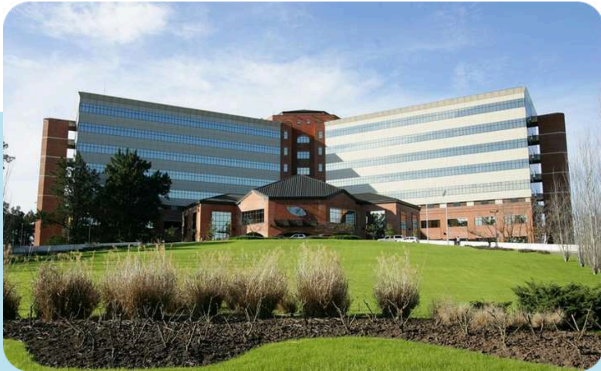
Hospital Universitario Austral