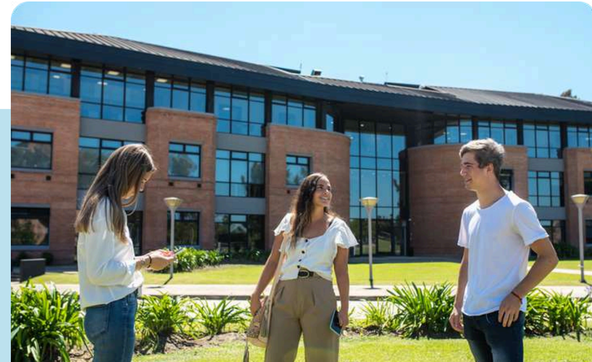
Parque Empresarial Austral