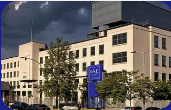
POLO DOT BAIRES