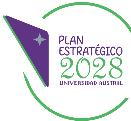
Cambiar la familia tipográfica