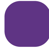
Pantone 268 C