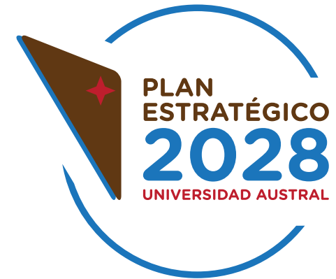
Cambiar la paleta cromática