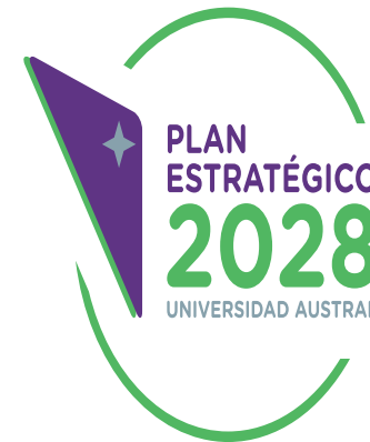
Modificar el tamaño de manera no proporcional