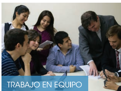
TRABAJO EN EQUIPO