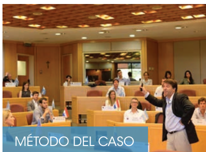
MÉTODO DEL CASO