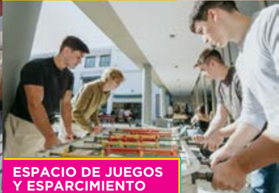
ESPACIO DE JUEGOS Y ESPARCIMIENTO