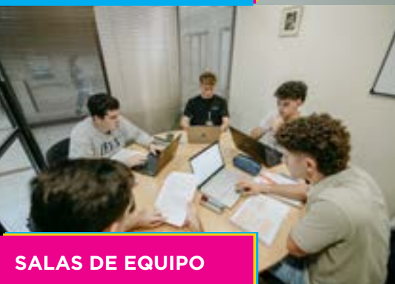
SALAS DE EQUIPO