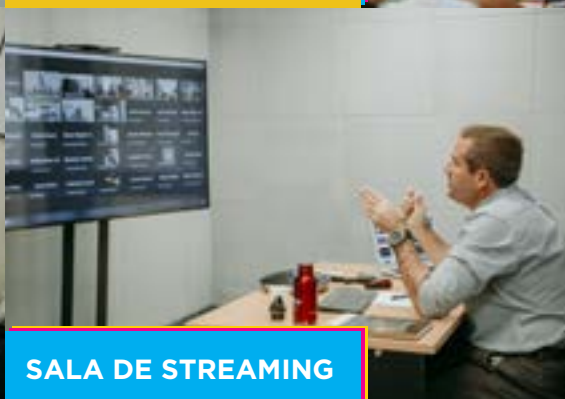
SALA DE STREAMING